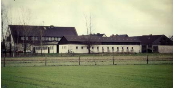
Das Bundessortenamt, Prüfstelle Rethmar

Ab 1945 war das Bundessortenamt in Rethmar über drei Jahrzehnte lang Zentrum des Saat- und Sortenwesens für Westdeutschland. Hier wurde entschieden, welche Pflanzensorten auf den Feldern und in den Gärten der Bundesrepublik angebaut werden durften, und es wurden die Grundlagen des heutigen Saatgutrechts geschaffen.